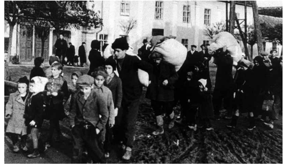
Magyarok áttelepítése a Felvidékről

Mindszenty József bíboros hercegprímás 1947. június 13-án repült el Kanadába, hogy ott részt vegyen a június 18–22. között megrendezett ottawai Mária-kongresszuson. A hercegprímás felfigyelt a kanadai katolikusok példás Mária tiszteletére. Hazatérőben a repülőgépen átgondolta az Ottawában támadt ötletét: „egy megrendezendő magyar Boldogasszony Éve tervét.” A püspöki kar július 25-i ülésén elfogadta a bíboros Mária-év hirdetésére vonatkozó javaslatát, és augusztus 15-re kitűzték az országos Boldogasszony Éve megnyitását. Augusztus 15-én az ország minden templomában felolvasták a püspöki kar körlevelét, amelyben a főpapok felhívták a hívek figyelmét: „... a Boldogasszonynak szentelt esztendő csak akkor éri el a célját, ha a magyarság lélekben is újra Mária nemzetévé lesz. ”