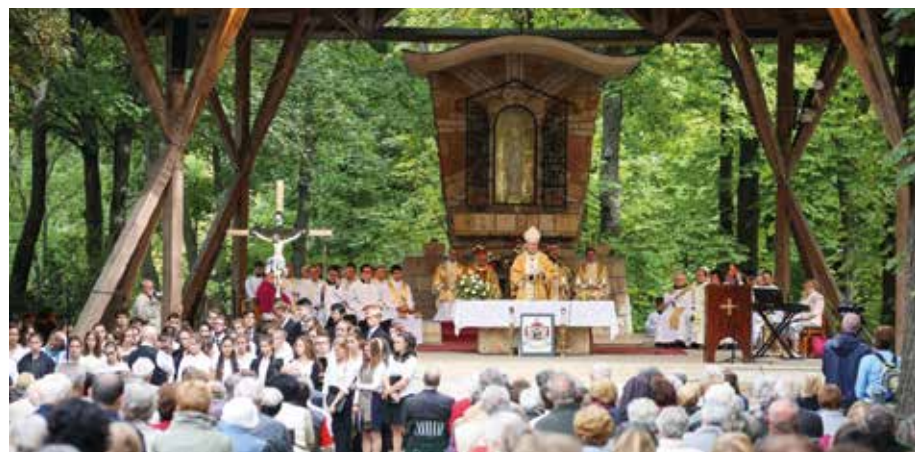
Szentmise Máriaremetén 2017-ben

A bíboros tudta, hogy hamarosan nagy egyházüldözés veszi kezdetét. Bár megtehetette volna, sorsa elől nem menekült külföldre, lélekben fel-