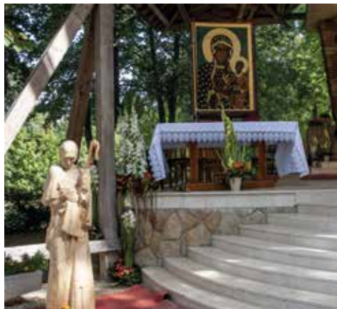
Mindszenty szobor és a chestochowai Szűzanya kép Máriaremetén 2012-ben

A Mindszenty zarándoklatba bekapcsolódott a „Békét az anyaméhben! A Szűzanyára bízunk az élet és szeretet kultúrájának védelmét”, a Csendes óceántól az Atlanti óceánig (18.000 km) életvédelmet hirdető zarándokok csoportja is –, akik utánfutóval vitték magukkal a chestochowai Fekete Madonna kegyképének másolatát, és éppen ebben az időben érkeztek Magyarországra. A kegyképet Máriaremetén a kegyoltár mellett helyezték el. Az esztergomi kispapok Mindszenty bíboros fából készült szobrát hozták el magukkal és helyezték el a szentély közelében.